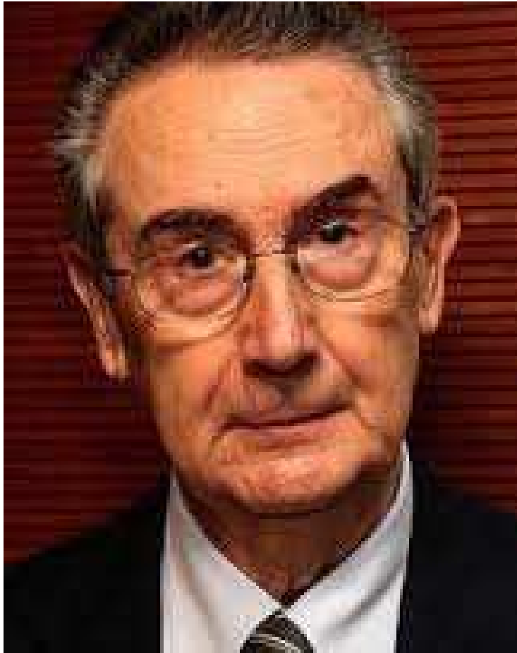
Il Prof. Luciano Gallino

Questa presentazione è dedicata ad un grande studioso che ci ha da poco lasciato: